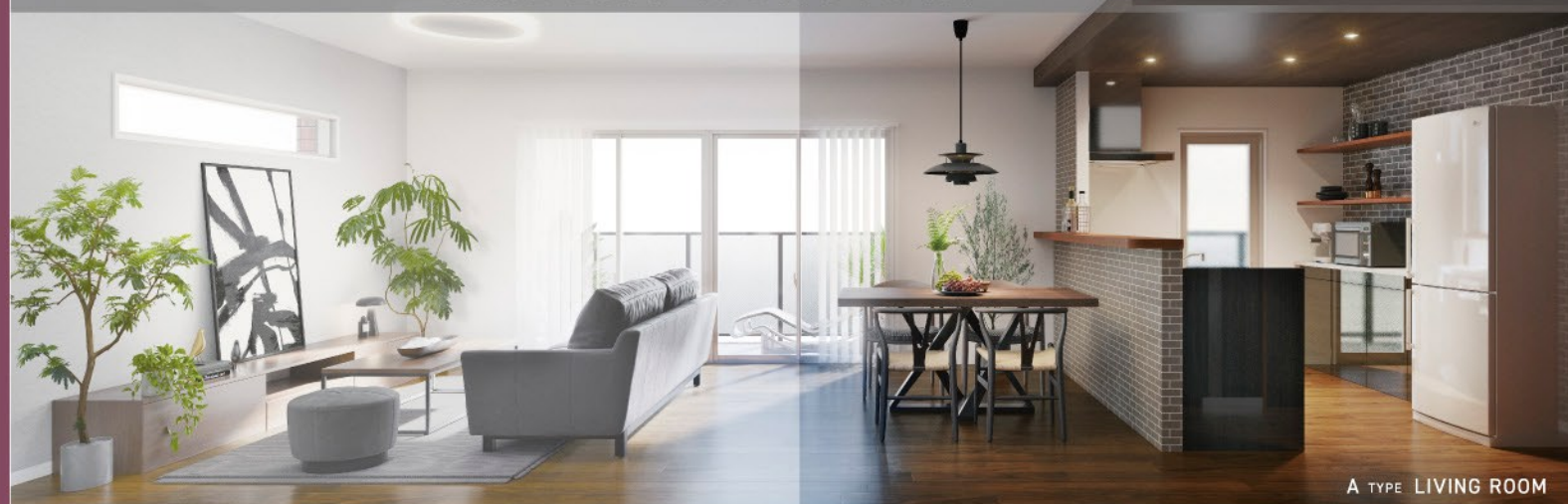
A TYPE LIVING ROOM