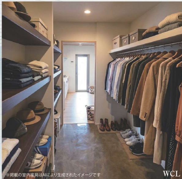
※掲載の室内家具はAIにより生成されたイメージです